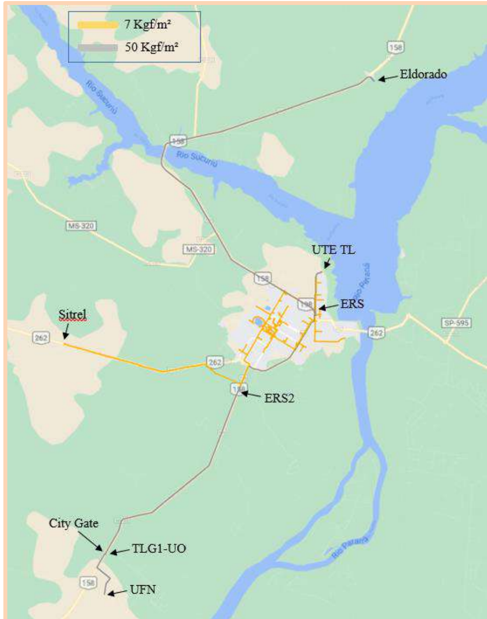
Sistema de Distribuição de três Lagoas.